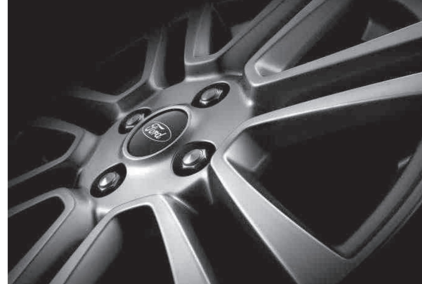
16"-os 7 küllős könnyűfém keréktárcsák (opcióként elérhető felárral)