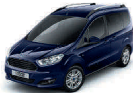
Blazer Blue Alapszín

A Tourneo Courier egy alapos, többlépcsős fényezési eljárásnak köszönheti tartós színét. A viaszos üregvédelemmel ellátott acél karosszériaelemek és a nagy kopásállóságú fedőlakkréteg, valamint az új anyagok és felhordási eljárások biztosítják, hogy a jármű még sok évig megőrizze vonzó külsejét.