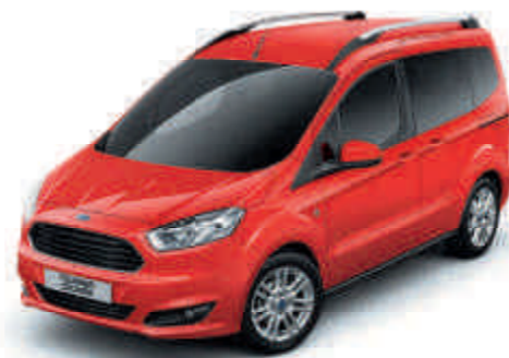
Race Red Alapszín