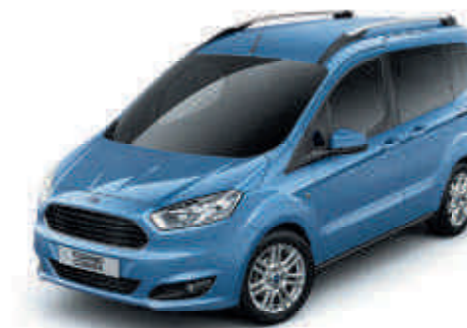
Iceberg Speciális metálfényezés*