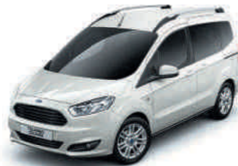
Frozen White Alapszín