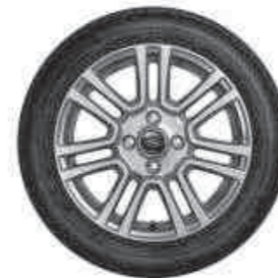
16"-os 7 küllős könnyűfém keréktárcsák (opcióként elérhető felárral)