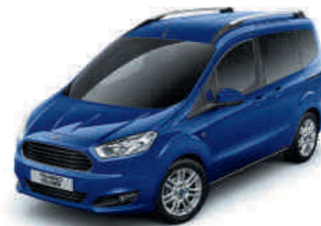
Deep Impact Blue Metálfényezés*