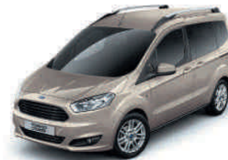
Tectonic Silver Metálfényezés*