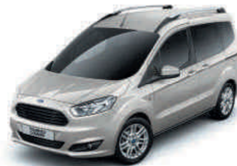
Moondust Silver Metálfényezés*