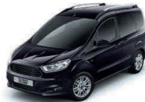
Absolute Black Metálfényezés*