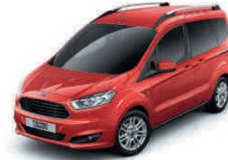
Venice Red Speciális metálfényezés*