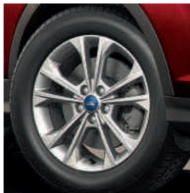
● 17"-os könnyűfém keréktárcsák