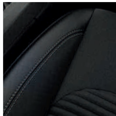
● Részben bőr ülések