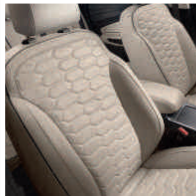
● Egyedi Vignale prémium bőr üléskárpit