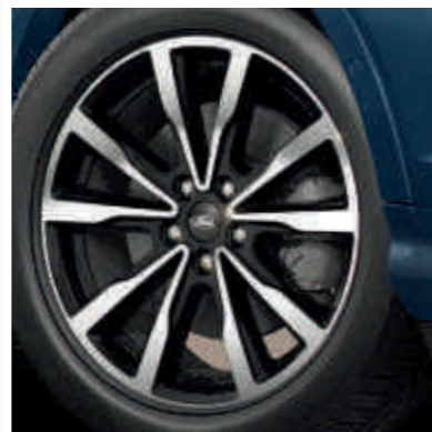
18"-os könnyűfém keréktárcsák