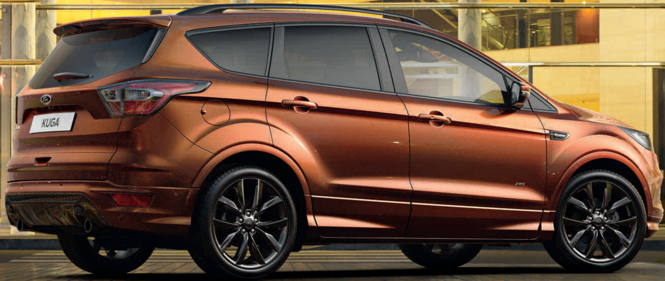
A képen látható modell egy Kuga ST-Line választható 19"-os könnyűfém keréktárcsákkal, nagy méretű hátsó spoilerrel és Copper Pulse metálfényezéssel.