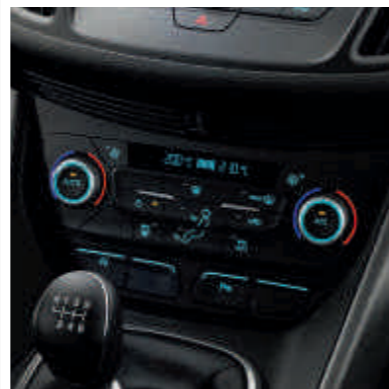
● Kétfázisú elektronikus automata légkondicionáló (DEATC)