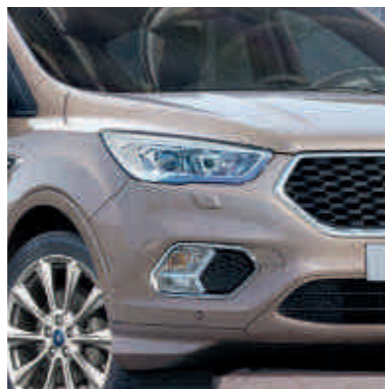
● Egyedi Ford Vignale külső megjelenés