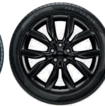
17" 5x2 küllős, Sparkle Silver könnyűfém keréktárcsa B T