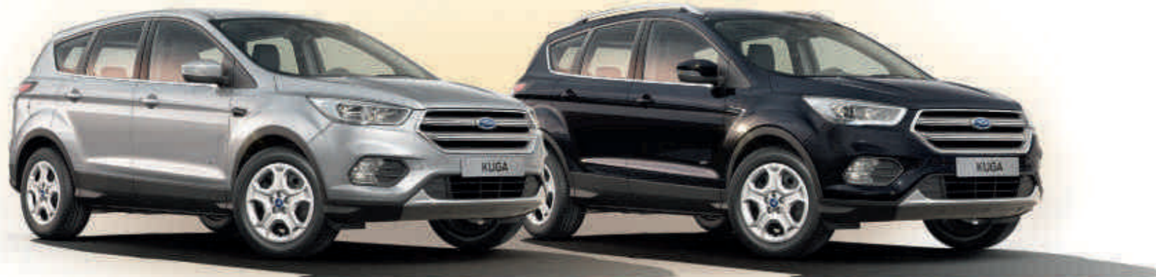
Trend (Nem elérhető)

Válassza az Önhöz leginkább illő Kuga modellt!