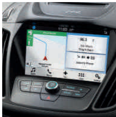
● Ford SYNC 3 Hangvezérléssel és 8"-os érintőképernyővel